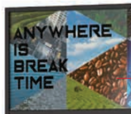
Design moderne et attractif