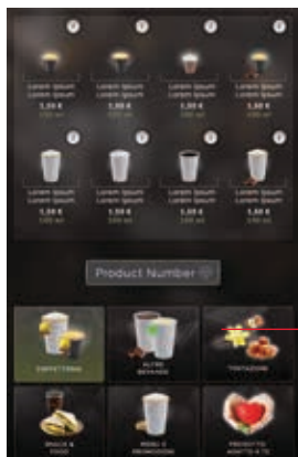
Interface utilisateur dynamique et Innovante