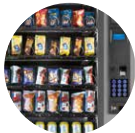
Un distributeur élégant et raffiné