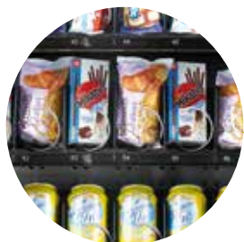
Vitrine haute visibilité