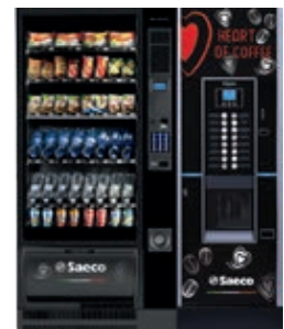
Artico L + Cristallo Evo 600